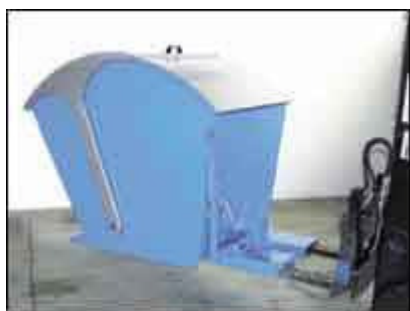
Typ RD lackiert blau RAL 5012