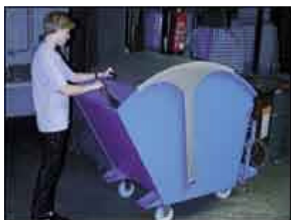
Typ RD bei Befüllung