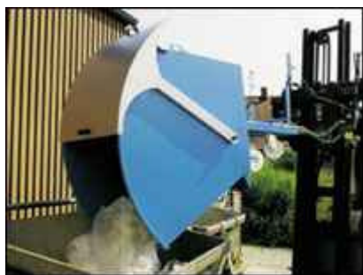
Typ RD mit Deckelarretierung bei Entleerung