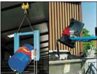
l: Typ FLEX-K mit Endloskette r: Typ FLEX-HK einer Entleerung 240 l Mülltonne