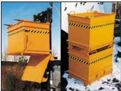
Typ BC Stapleraufnahme / Typ BC gestapelt