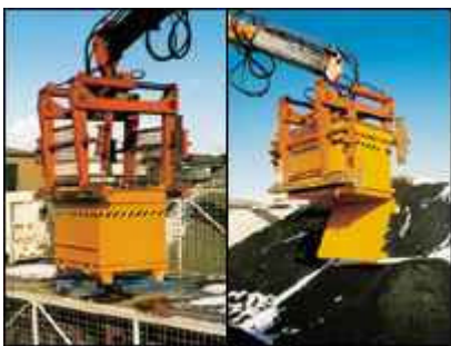
Typ BC Steinklammeraufnahme / -entleerung