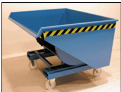
Typ EXPO mit Rollen